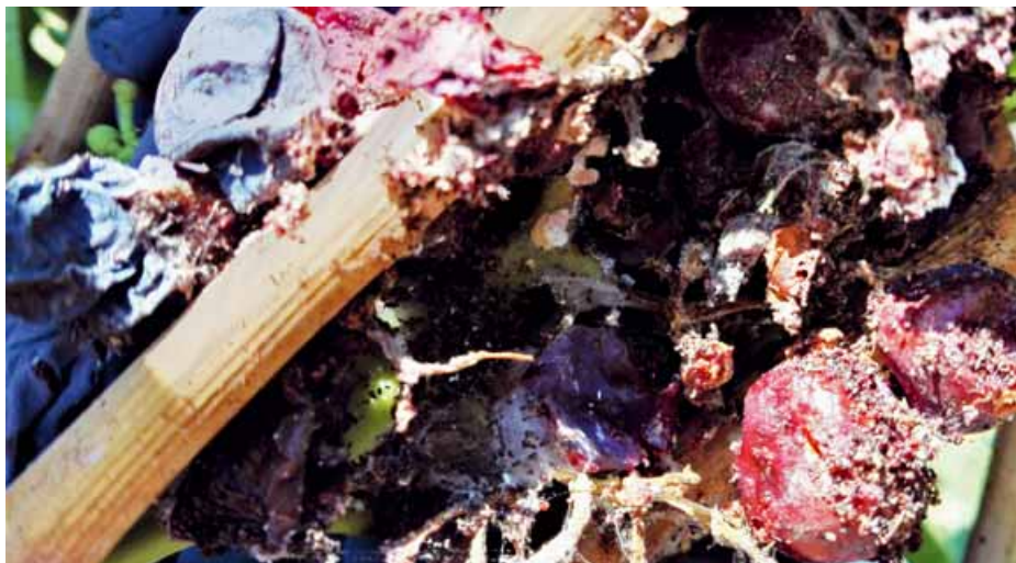
Foto 4 Evidente presenza di Planococcus ficus in grappolo in cui erano presenti larve di Cryptoblabes gnidiella

abbiamo riscontrato nello stesso grappolo la presenza di larve di Lobesia botrana in commensalismo (foto 3), o forme mobili di P. ficus (foto 4), in linea con quanto riportato nella letteratura scientifica (Lucchi, 2017).