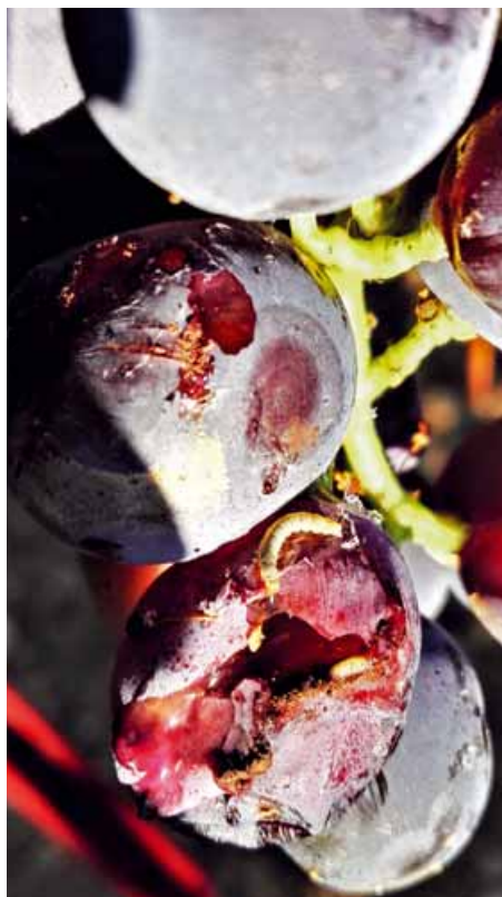
Foto 3 Larva di Lobesia botrana trovata nel medesimo grappolo in cui erano presenti larve di Cryptoblabes gnidiella

Segnaliamo, inoltre, che in qualche caso, oltre alle larve della criptoblabe,