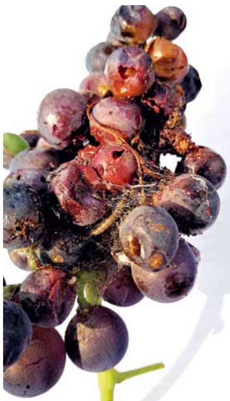
Foto 2 Grappolo con evidente presenza di Cryptoblabes gnidiella

un andamento del volo assai blando per tutto il mese di luglio. Inoltre, l'attento monitoraggio dei grappoli a seguito delle prime catture, non si è mai risolto con il ritrovamento di larve e danni ascrivibili alla specie C. gnidiella . Anche il rilevamento della presenza di adulti ai primi di agosto non ha mai portato a osservare danni e larve della criptoblabe a seguito dei controlli effettuati in campo.