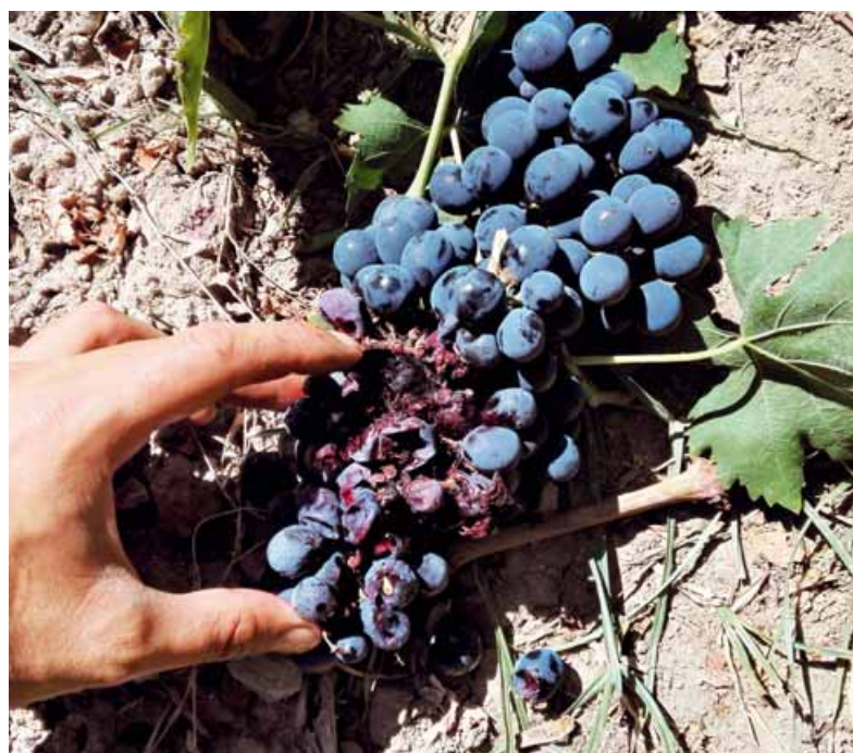
Foto 1 Grappolo affetto da attività trofica a carico di larve della Cryptoblabes gnidiella

Le prime catture sono state rinvenute in data 20 giugno con un andamento del volo assai blando per tutto il mese di luglio. Il volo ha ripreso a essere relativamente più consistente a fine agosto: in data 22-08 sono stati contati nella trappola 8 adulti.